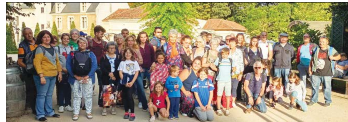
Journée au Puy du Fou, lorsque les amateurs rencontrent leur source d'inspiration.