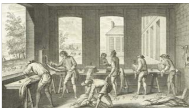
Fig. 4 – Planche de l'Encyclopédie du XVIIIe siècle. Les peignes étaient fixés sur l'établi. Les ouvriers passaient la filasse de chanvre dans les dents des peignes. Au sol, les écheveaux de fibres peignées prêtes à être filées.

Puis, les femmes filaient avec un rouet [fig. 5]. Elles y passaient la nuit, les pauvres vieilles ! Elles mangeaient des prunes pour faire de l'eau avec leur salive. Ma défunte mère faisait filer le vieille Laluque, les deux vieilles des Rivailles, la vieille Bonneset et la vieille Burguetta. Toutes les vieilles qu'elle trouvait, elle les faisait filer ! Après, il fallait faire une pelote de fil. Le tisserand de la Montagne (6) venait un dimanche chercher le fil chez nous.