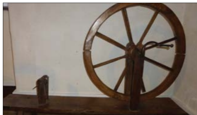
Fig. 5 – Rouet ancien sans pédale. Il fallait, d'une main, tourner la roue avec la manivelle et, de l'autre, conduire le fil. Avec un rouet à pédale, les deux mains étaient libres pour mener le fil.

Ces propos ont été recueillis en langue limousine sur un