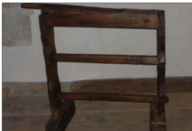
Fig. 2 – La bargua à broyer les tiges de chanvre